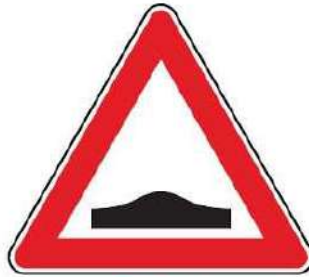
FIG. 2 DOSSO