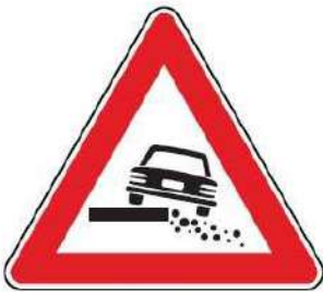
FIG. 21 BANCHINA CEDEVOLE