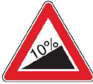
FIG. 16 SALITA RIPIDA