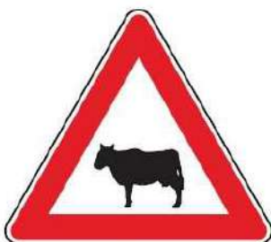
FIG. 24 ANIMALI DOMESTICI VAGANTI