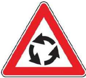
FIG. 27 CIRCOLAZIONE ROTATORIA