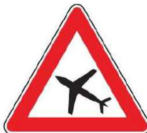
FIG. 32 AEROMOBILI