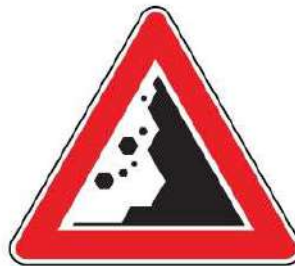
FIG. 30/b CADUTA MASSI