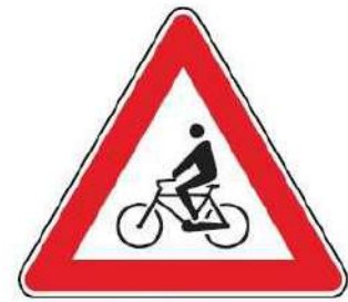
FIG. 14 ATTRAVERSAMENTO CICLABILE