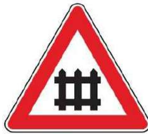
FIG. 8 PASSAGGIO A LIVELLO CON BARRIERE