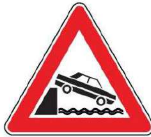
FIG. 28 SBOCCO SU MOLO O SU ARGINE