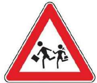
FIG. 23 BAMBINI