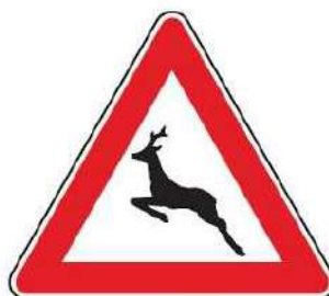
FIG. 25 ANIMALI SELVATICI VAGANTI