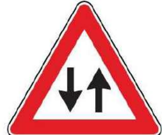
FIG. 26 DOPPIO SENSO DI CIRCOLAZIONE