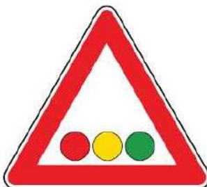
FIG. 31/b SEMAFORO