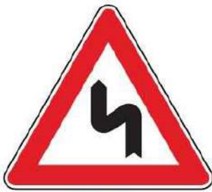
FIG. 7 DOPPIA CURVA, LA PRIMA A SINISTRA