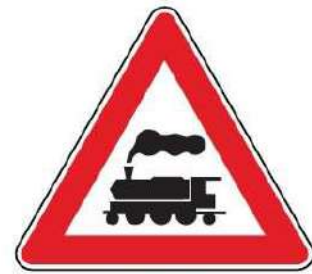
FIG. 9 PASSAGGIO A LIVELLO SENZA BARRIERE