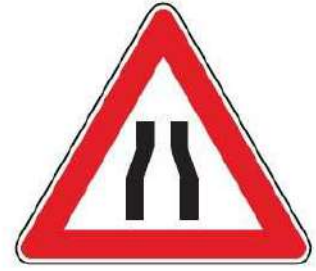
FIG. 17 STRETTOIA SIMMETRICA