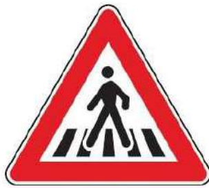
FIG. 13 ATTRAVERSAMENTO PEDONALE