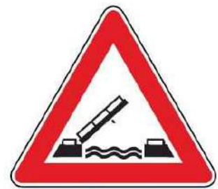
FIG. 20 PONTE MOBILE