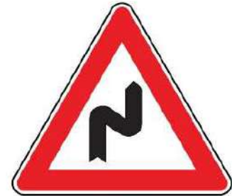
FIG. 6 DOPPIA CURVA, LA PRIMA A DESTRA