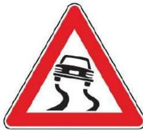
FIG. 22 STRADA SDRUCCIOLEVOLE