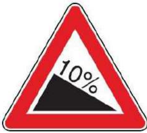
FIG. 15 DISCESA PERICOLOSA