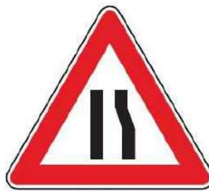
FIG. 19 STRETTOIA ASIMMETRICA A DESTRA