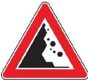
FIG. 30/a CADUTA MASSI