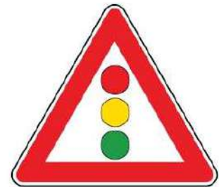
FIG. 31/a SEMAFORO