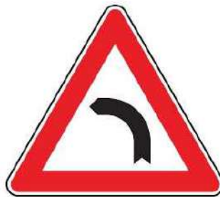
FIG. 5 CURVA A SINISTRA