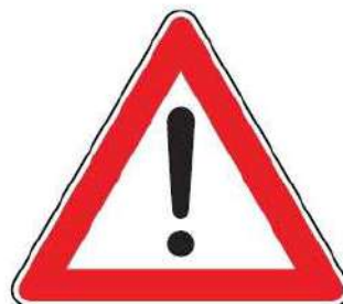
FIG. 35 ALTRI PERICOLI