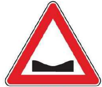
FIG. 3 CUNETTA