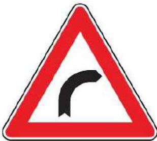
FIG. 4 CURVA A DESTRA