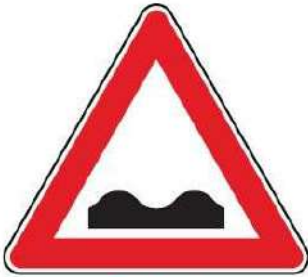
FIG. 1 STRADA DEFORMATA