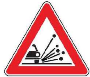
FIG. 29 MATERIALE INSTABILE SULLA STRADA