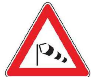
FIG. 33 FORTE VENTO LATERALE