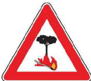
FIG. 34 PERICOLO DI INCENDIO