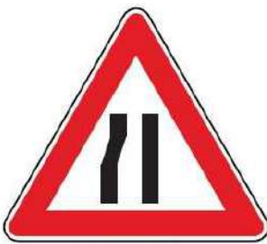
FIG. 18 STRETTOIA ASIMMETRICA A SINISTRA